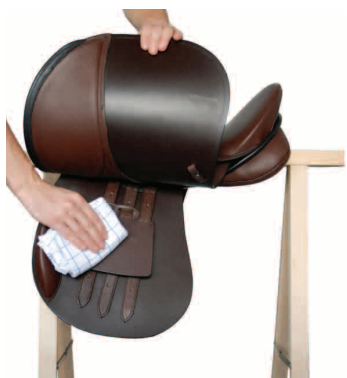
7. Trocknen Unterseite Sattelblätter