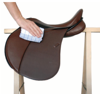
6. Trocknen der Sattelblätter