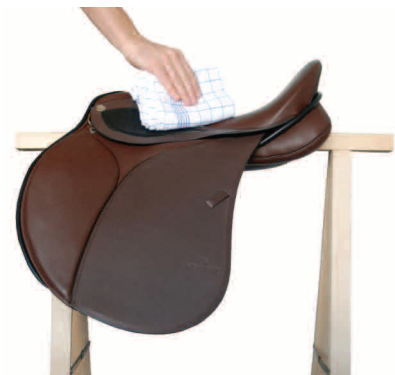
5. Trocken des Sitzes und der kl. Tasche